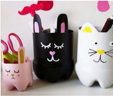
Avec des bouteilles plastiques!!!!

Activités diverses avec du matériel de récupération: