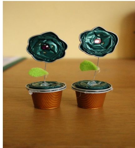
Avec des capsules café!!!

Sortie spectacle: « Les bruits du noir » THEATRE EPIDAURE DE BOULOIRE